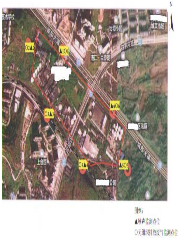
图 3 监测点位示意图