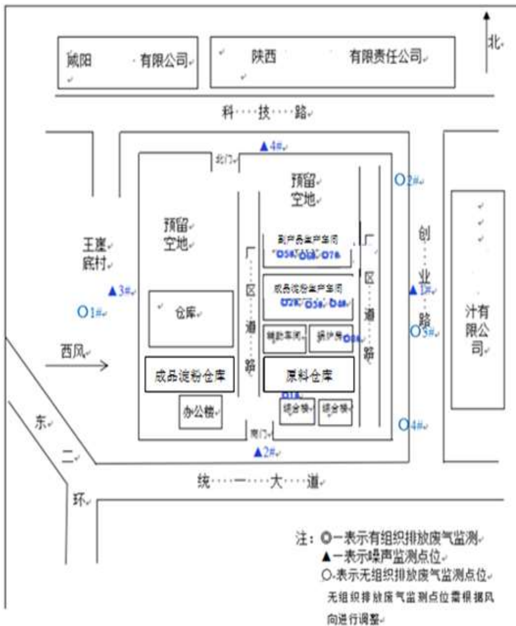
图 3 监测点位示意图