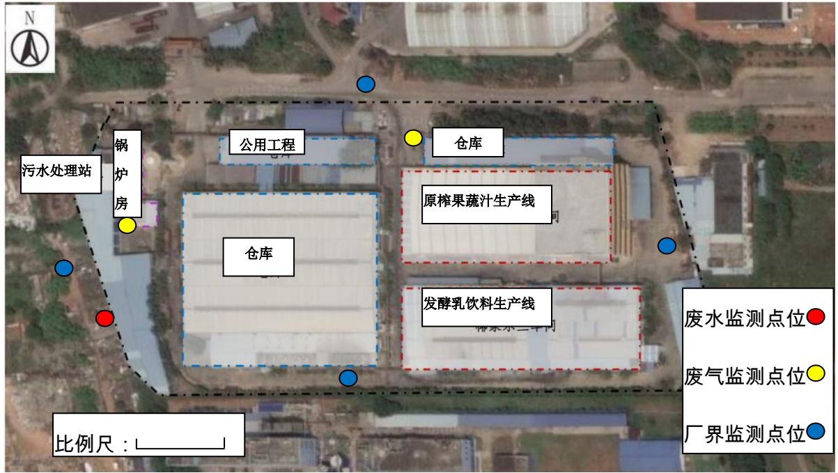
图 4 监测点位示意图