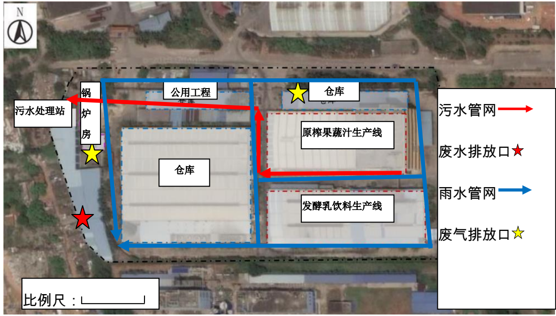
图 3 生产厂区总平面布置图