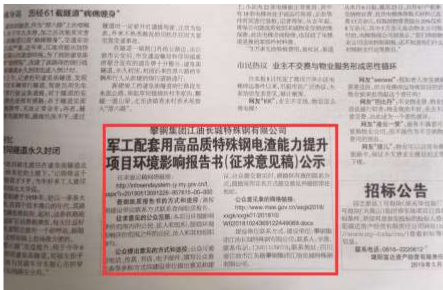
图3-3 2019年5月24日《绵阳晚报》刊登内容