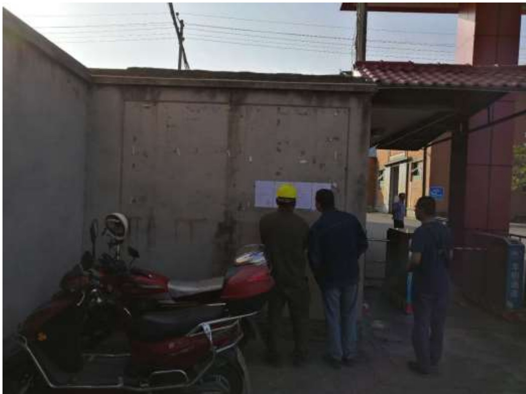
图 3-5 长钢中坝生活区公示栏张贴公示照片