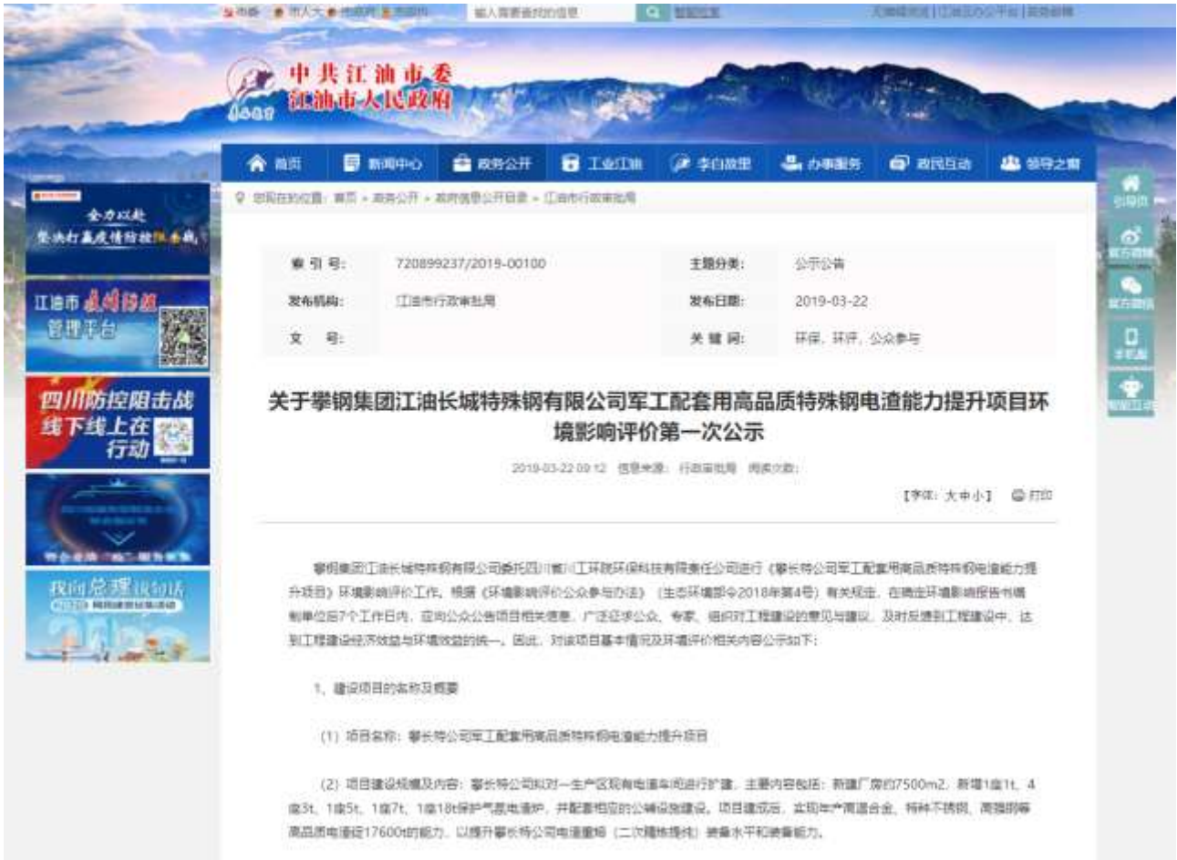
图2-1 首次环境影响评价信息网络公开截图