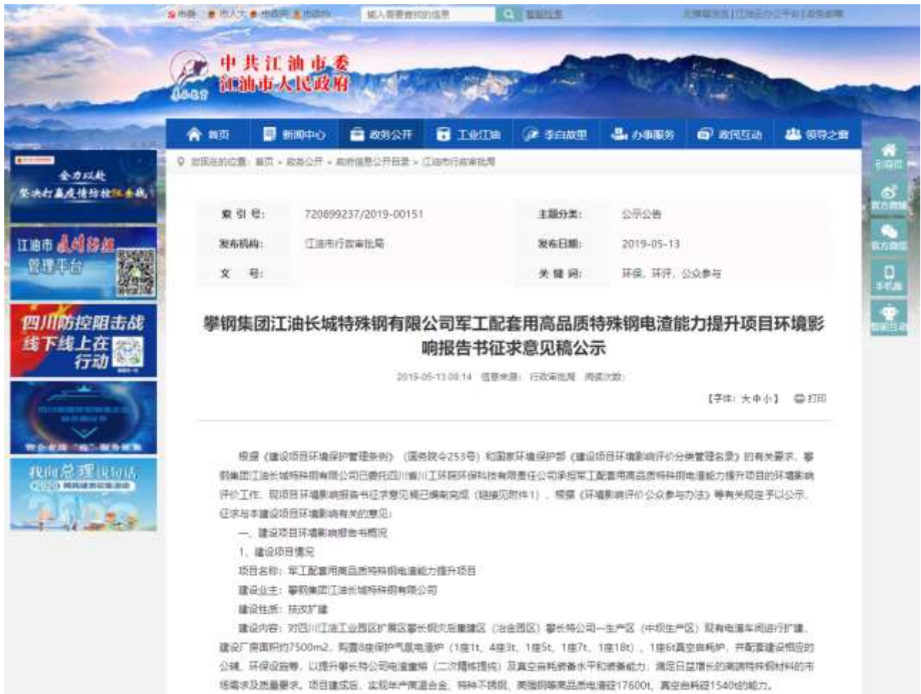
图3-1 征求意见稿网络公示截图

本项目于2019年5月13日~2019年5月24日在江油市人民政府网站的公示栏对《攀钢集团江油长城特殊钢有限公司军工配套用高品质特殊钢电渣能力提升项目环境影响报告书（征求意见稿）》进行了征求意见稿网络公示（ http://www.jiangyou.gov.cn/public/5061/13182721.html ），公示内容见图3-1。