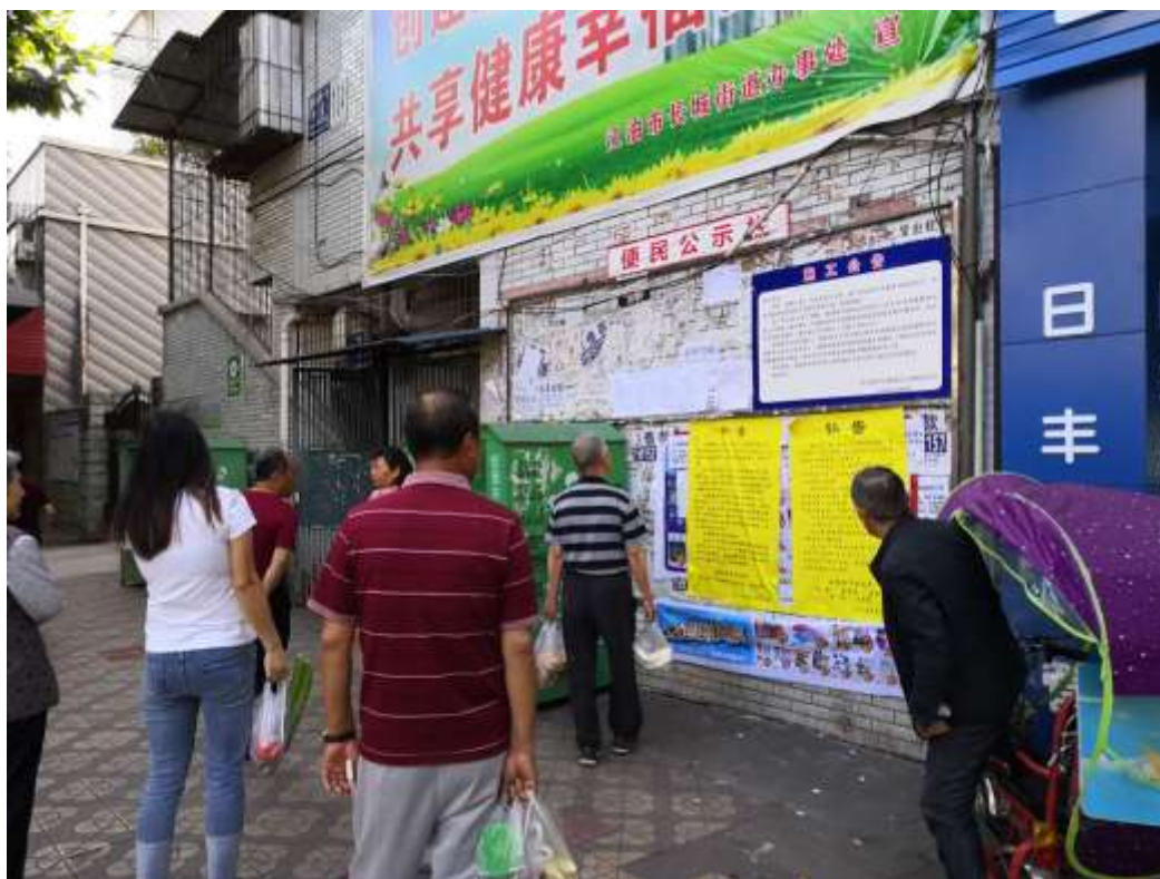
图 3-4 长城街道便民公示栏张贴公示照片