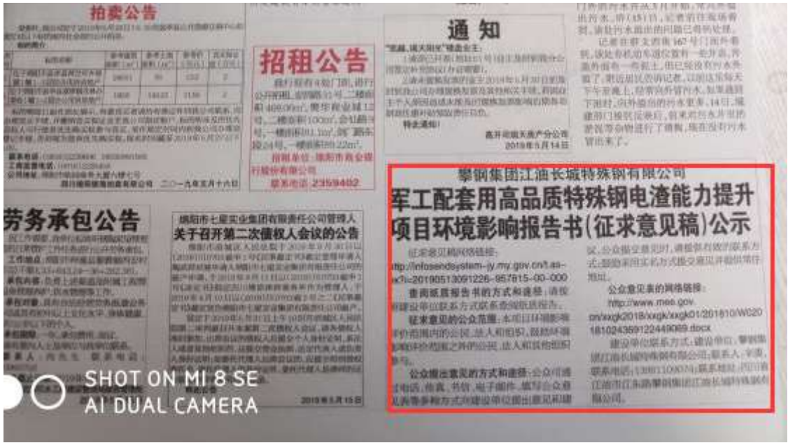
图3-2 2019年5月14日《绵阳晚报》刊登内容