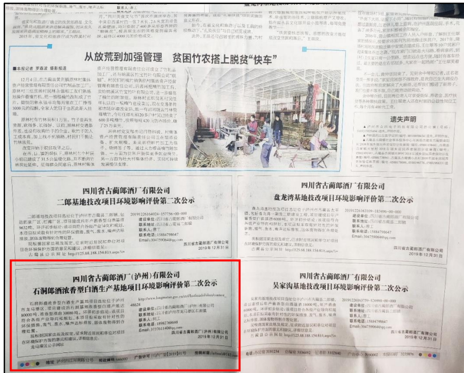
图 3.2-3 2019 年 12 月 31 日泸州日报公示截图