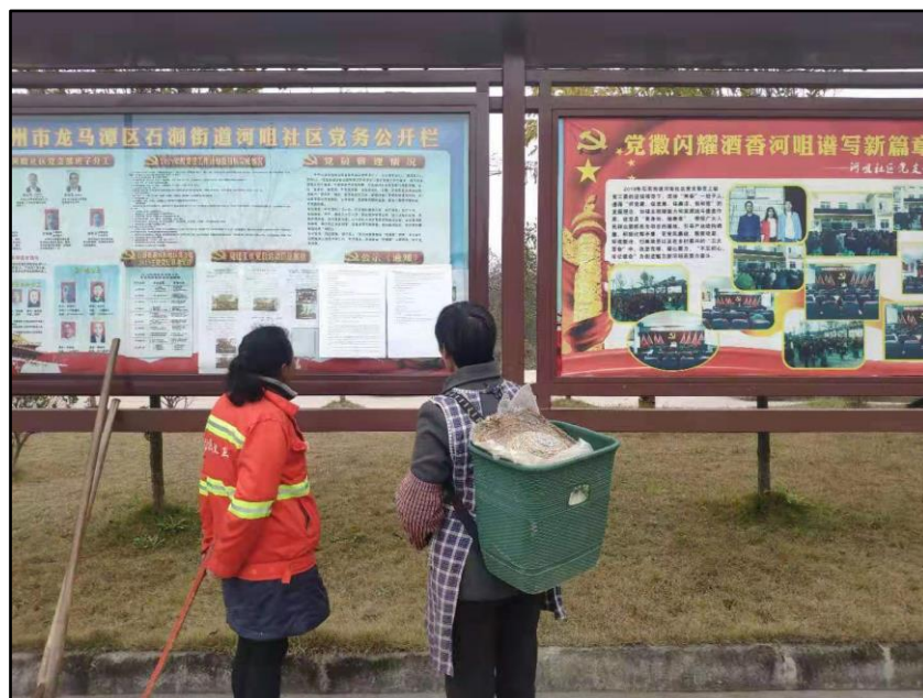
图 3.2-4 现场张贴公示照片