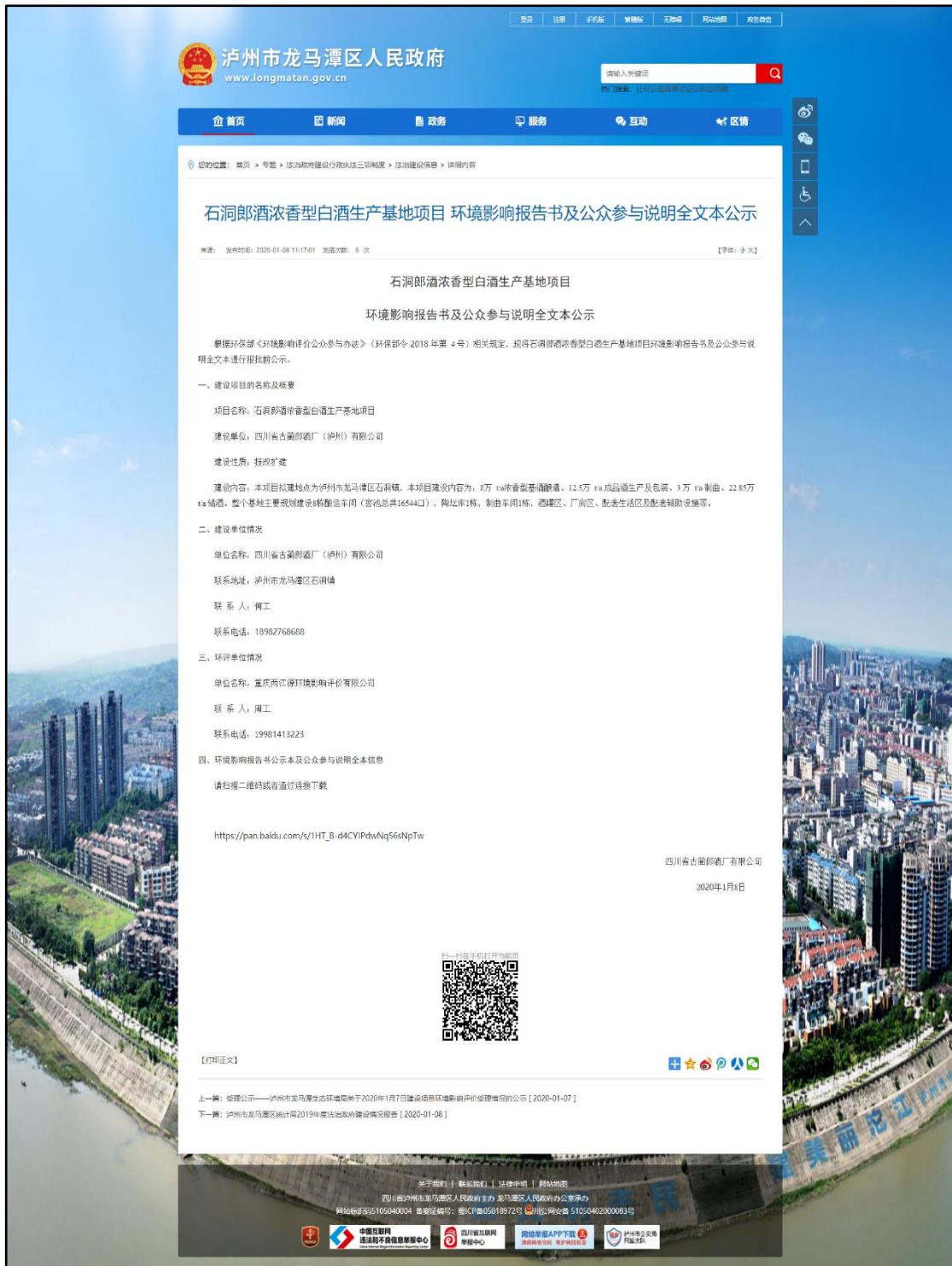
图 6.2-1 报批前全本公开网上截图照片