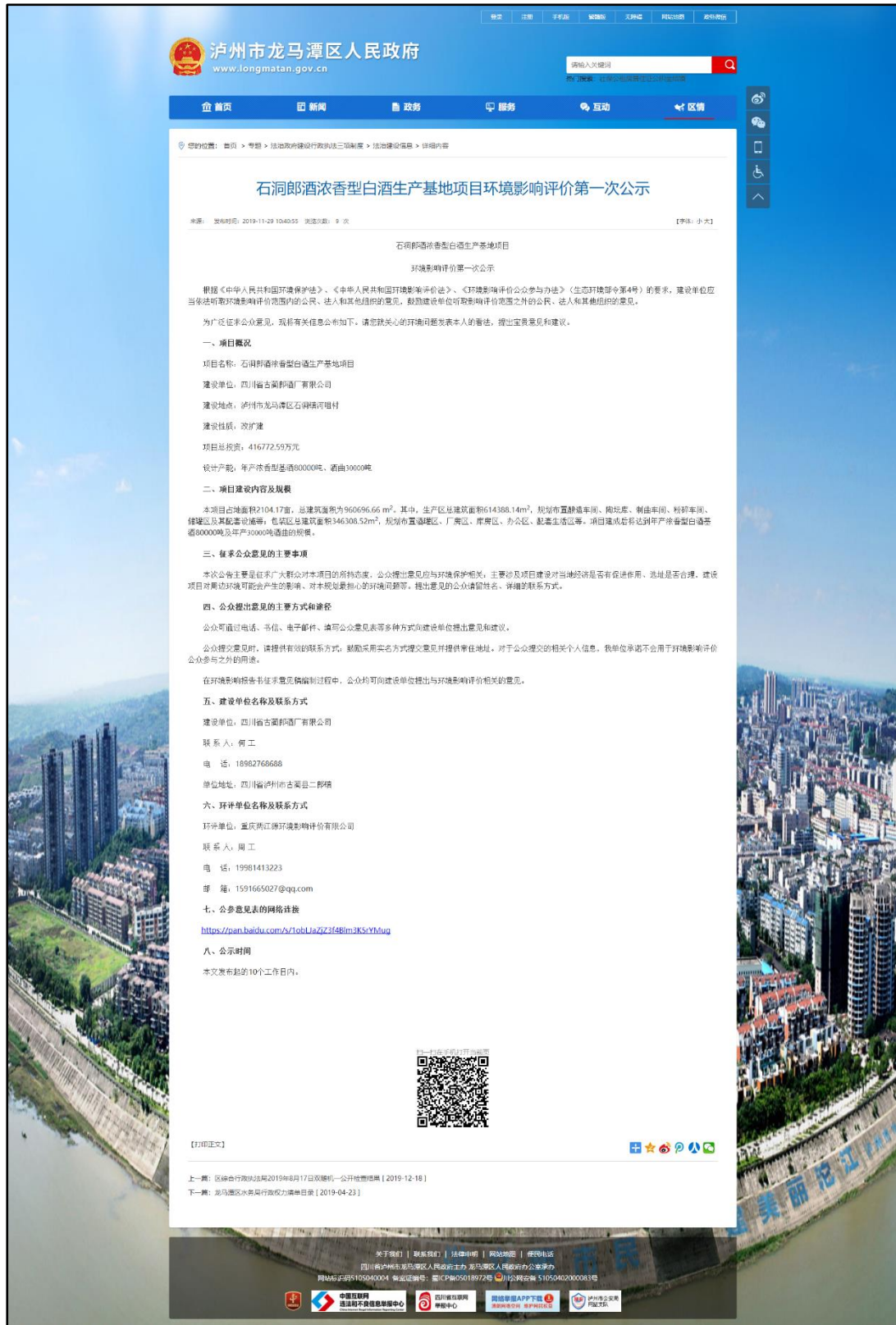
图 2.2-1 第一次环境影响评价信息公开网页截图

longmatan.gov.cn/ztl/hzzfsxzdzl/zhxx/content_48327), 符合《环境影响评价公众参与暂行办法》中相关要求。