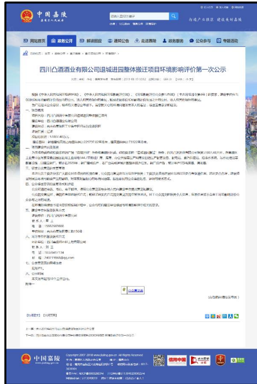
图 2.2-1 第一次环境影响评价信息公开网页截图

月 19 日在中国嘉陵(嘉陵区人民政府官网)进行了首次环境影响评价信息公示,满足《环境影响评价公众参与办法》规定的不少于 10 个工作日的要求,公示网址为 ( http://www.jialing.gov.cn/a/qsydwxxgk/2019/0826/20090.html ),符合《环境影响评价公众参与暂行办法》中相关要求。