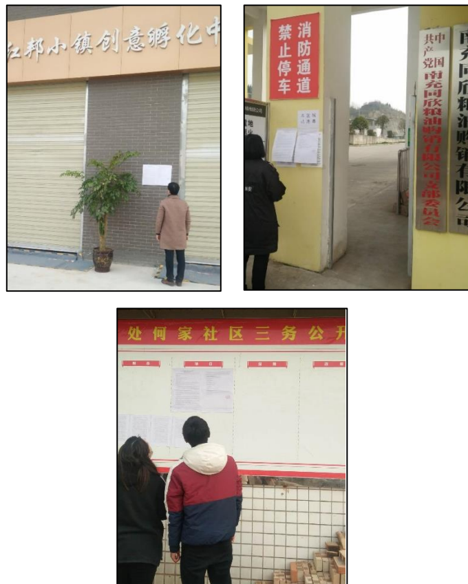
图 3.2-4 现场张贴公示照片

在项目第二次网络公示期间，建设单位同步进行张贴公告。张贴公示期为：2020 年 2 月 12 日至今日，张贴地点为项目所在地的周边所在地公众易于知悉的场所，符合《环境影响评价公众参与办法》的要求。张贴现场照片如下所示：