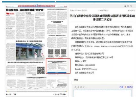
图 3.2-3 2020 年 2 月 17 日南充日报公示截图