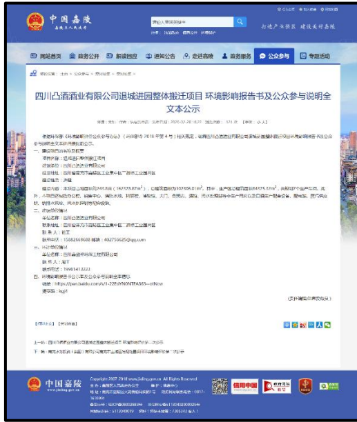
图 6.2-1 本项目环境影响评价报批前公示网页截图