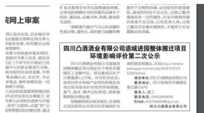
图 3.2-2 2020 年 2 月 12 日南充日报公示截图

第二次网络公示期间，我公司同步在当地公众易于接触的《南充日报》进行 2 次登报公示，登报时间分别为为 2020 年 2 月 14 日和 2 月 17 日。分析认为，登报公示的载体符合《环境影响评价公众参与办法》的要求，公示登报截图如下所示：