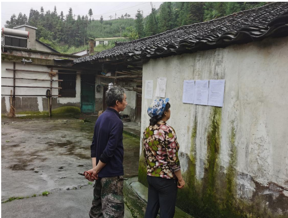
图 3-4 项目环境影响评价第二次公示张贴照片

建设单位于2020年8月12日在四川石棉工业园的公告栏进行了10个工作日的张贴公示，符合《环境影响评价公众参与办法》要求。项目张贴公示见图3-4。