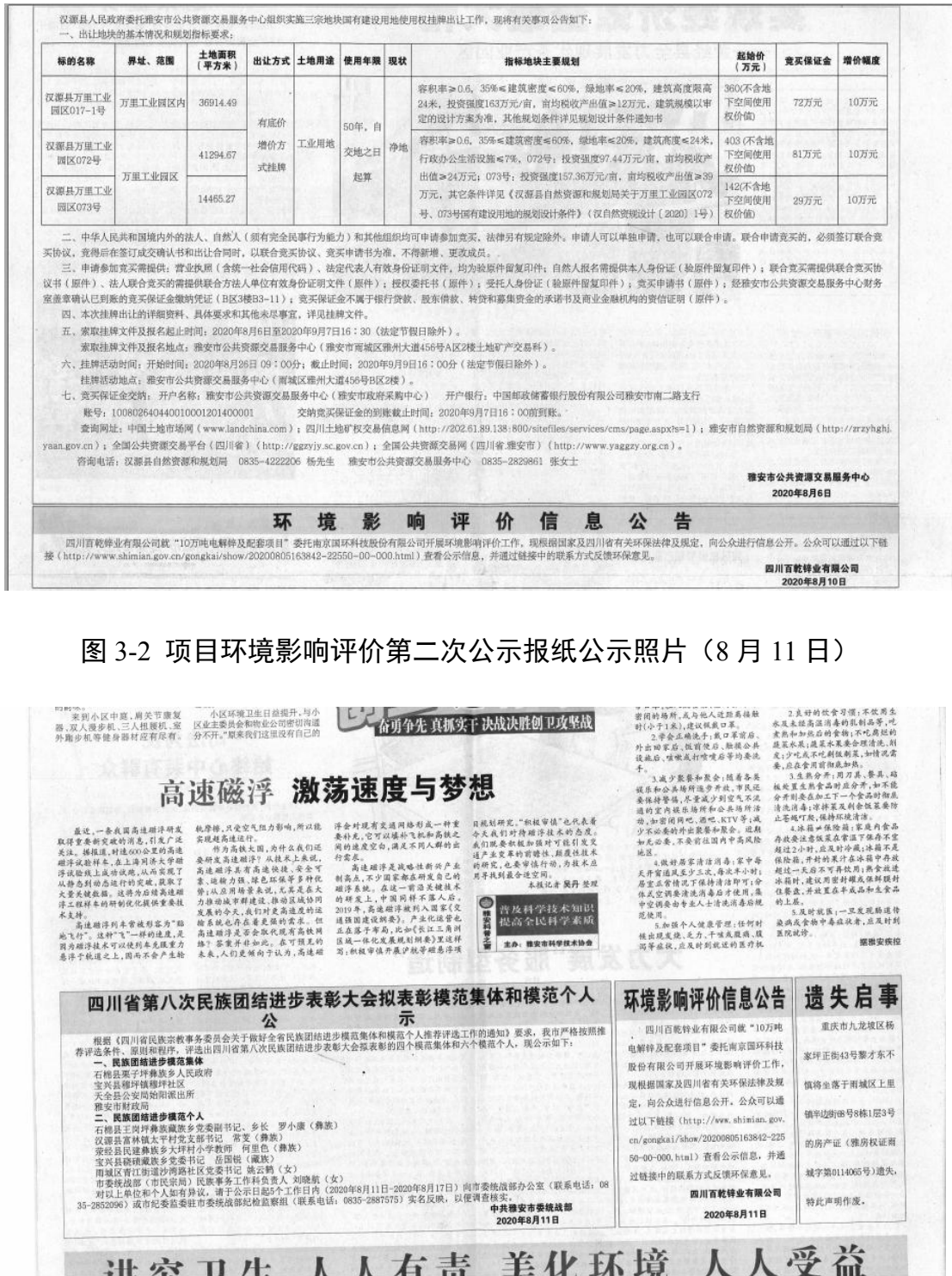
图 3-2 项目环境影响评价第二次公示报纸公示照片(8月11日)

日在雅安日报上进行了报纸公示。本项目的报纸公示符合《环境影响评价公众参与办法》要求。项目报纸公示内容见图 3-2 和 3-3。