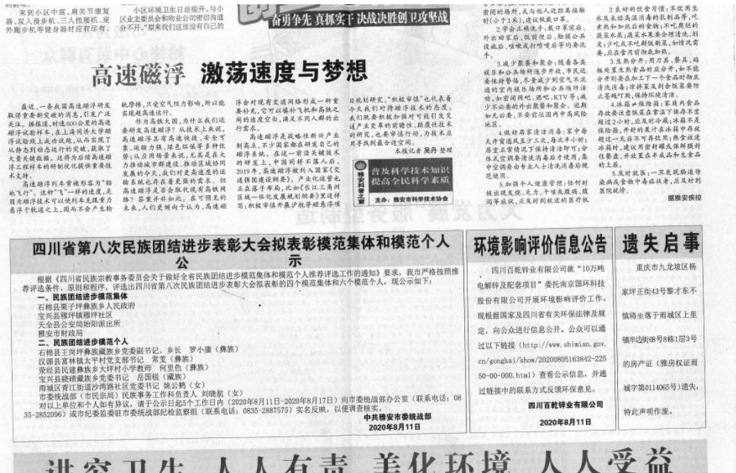
图 3-3 项目环境影响评价第二次公示报纸公示照片(8月11日)