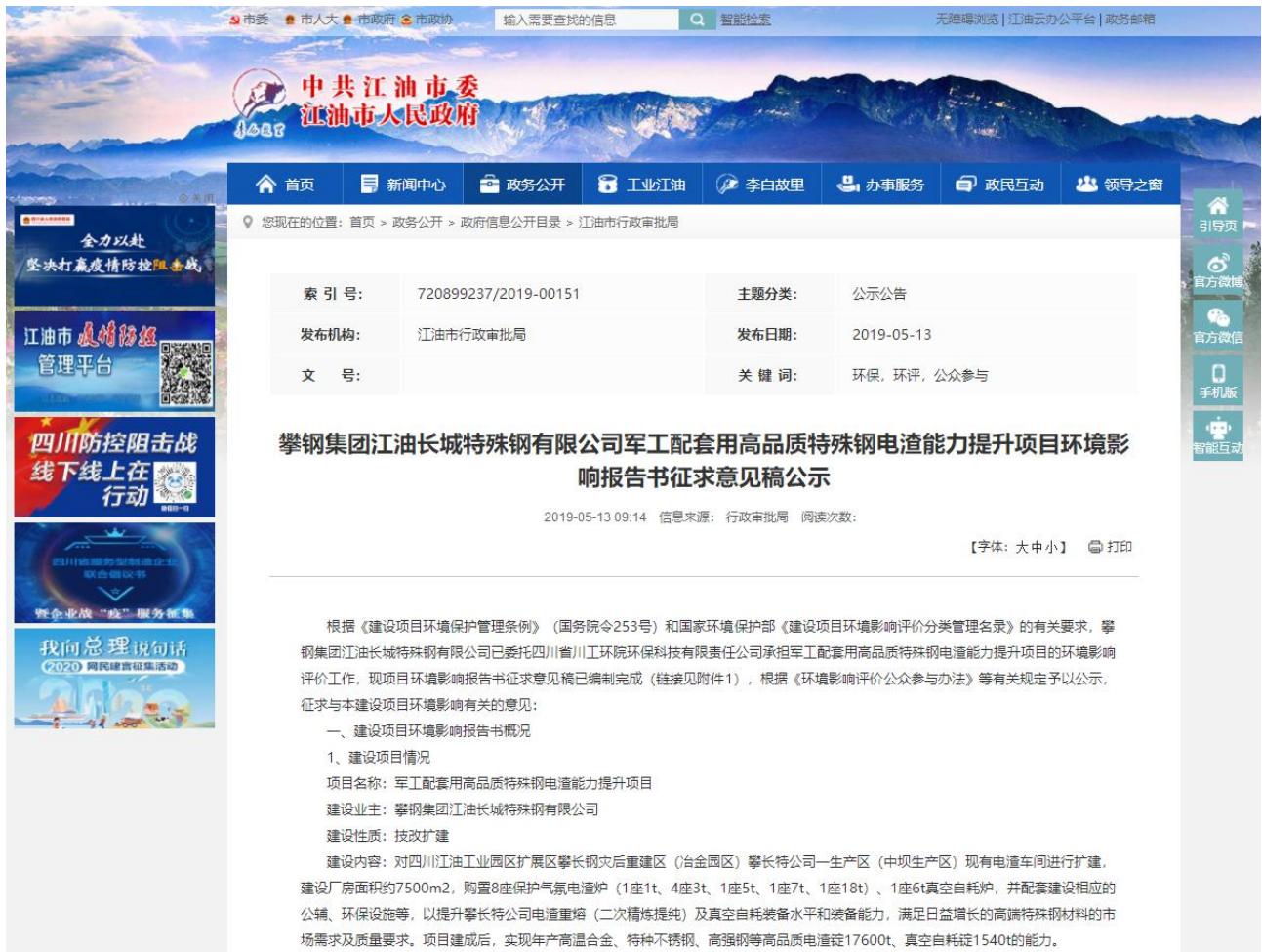
图3-1 征求意见稿网络公示截图

本项目于2019年5月13日~2019年5月24日在江油市人民政府网站的公示栏对《攀钢集团江油长城特殊钢有限公司军工配套用高品质特殊钢电渣能力提升项目环境影响报告书（征求意见稿）》进行了征求意见稿网络公示（ http://www.jiangyou.gov.cn/public/5061/13182721.html ），公示内容见图3-1。