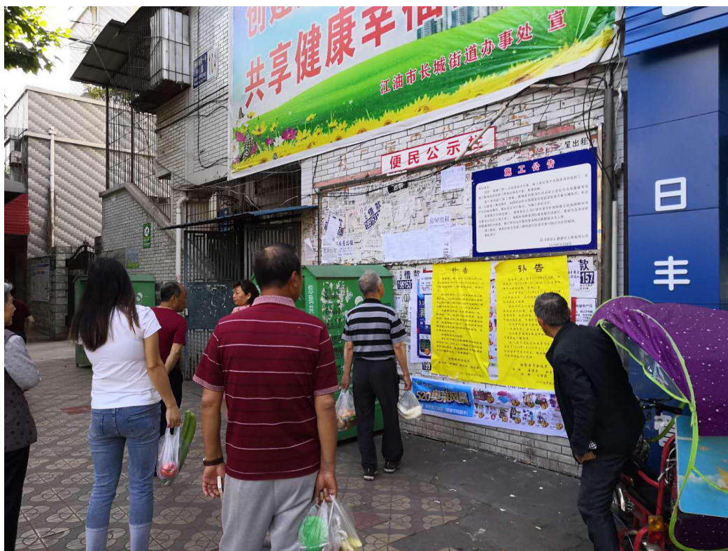
图 3-4 长城街道便民公示栏张贴公示照片