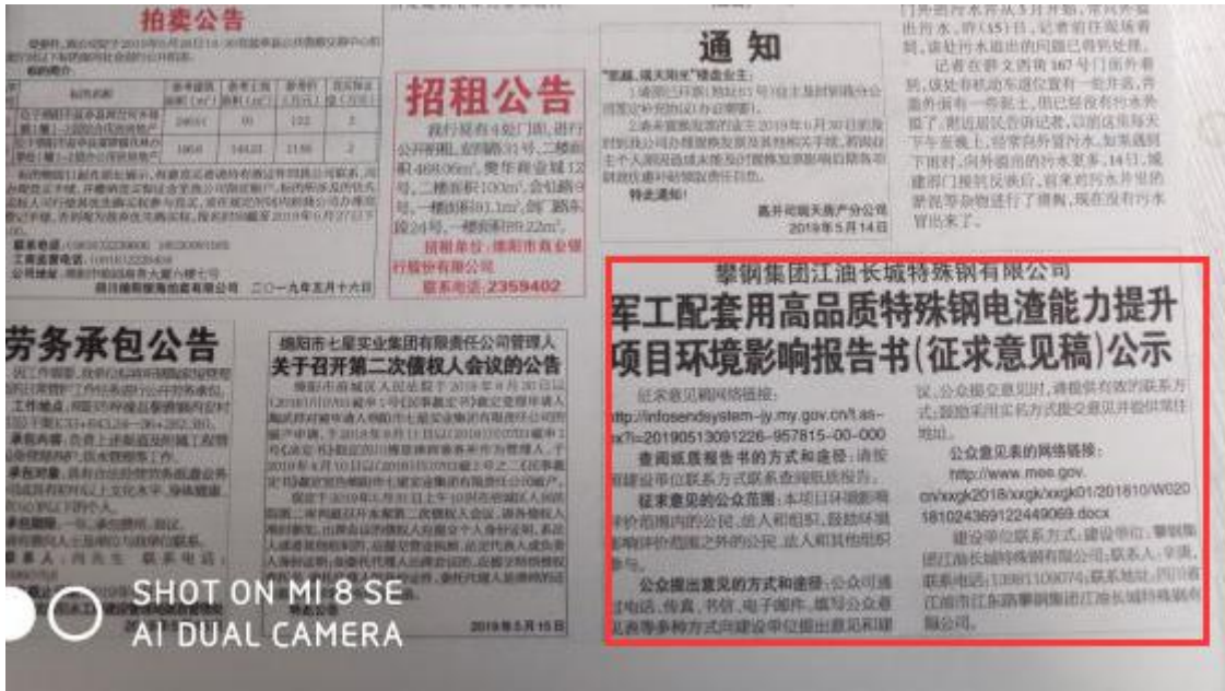
图3-2 2019年5月14日《绵阳晚报》刊登内容