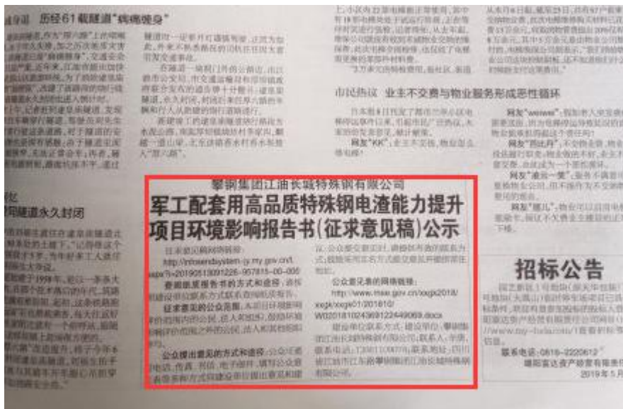
图3-3 2019年5月24日《绵阳晚报》刊登内容