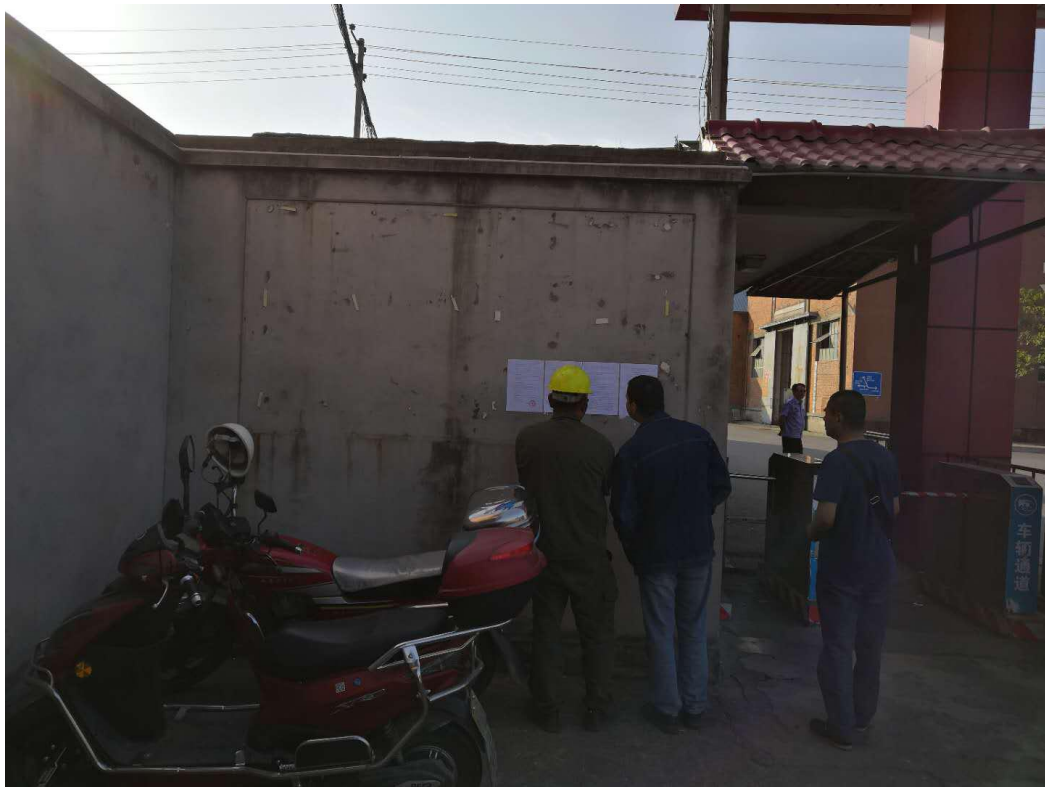
图 3-5 攀长特中坝生活区公示栏张贴公示照片