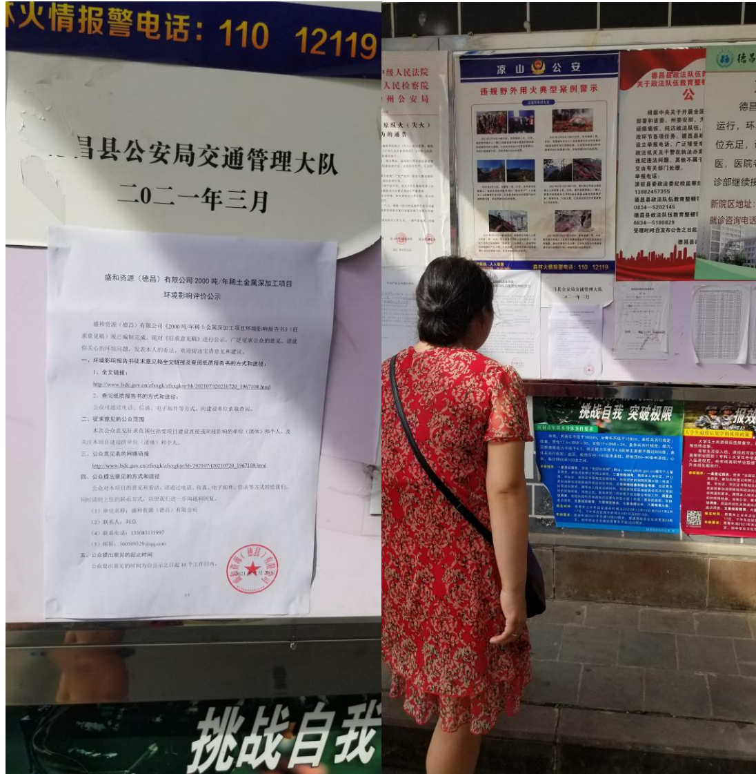
图 3-4 现场张贴公告

我公司于2021年7月20日在项目所在乡镇公示栏张贴了本项目环境影响评价第二次公示的公告。具体情况见图3-4。