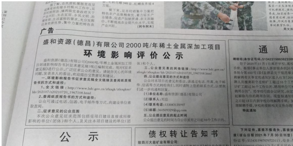
图 3-2 2021 年 7 月 30 日报纸公示

我公司分别于 2021 年 7 月 30 日、2021 年 7 月 31 日在《凉山日报》进行了两次报纸公示。报纸截图见图 3-2 和图 3-3。《凉山日报》为区域性公开媒体，选择该报纸进行公示，符合《环境影响评价公众参与办法》“通过建设项目所在地公众易于接触的报纸公开，且在征求意见的 10 个工作日内公开信息不得少于 2 次”的要求。