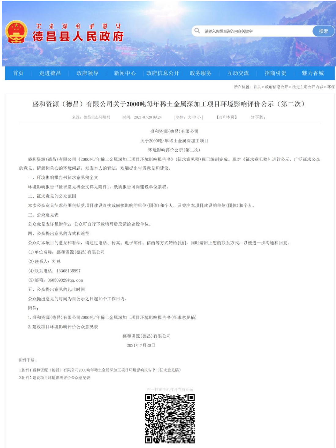
图 3-1 第二次公示网络公示截图