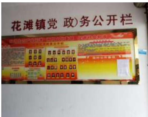
花滩镇政府张贴公告