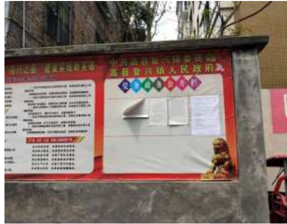
复兴镇政府张贴公告