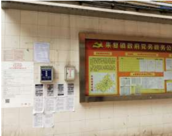
来复镇政府张贴公告

2019年4月1日-4月3日在高县、长宁、珙县沿线涉及的乡镇村庄等20余处敏感点张贴宜宾至威信高速公路（四川境）环境影响评价公众参与第一次公示，部分地点张贴公告照片见图2。