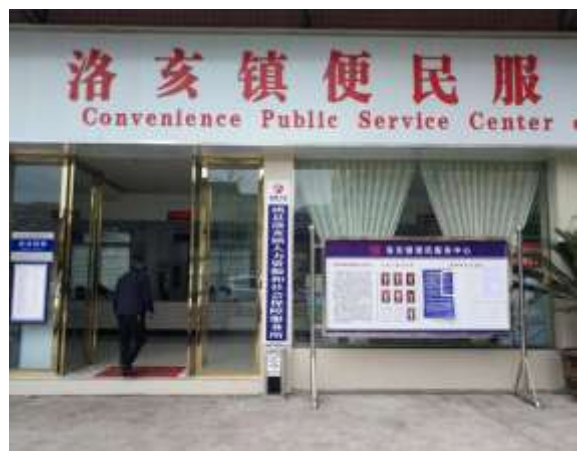
洛亥镇政府张贴公告