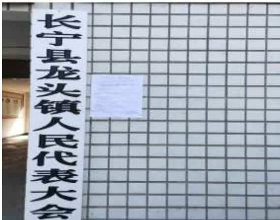
长宁县龙头镇人民代表大会