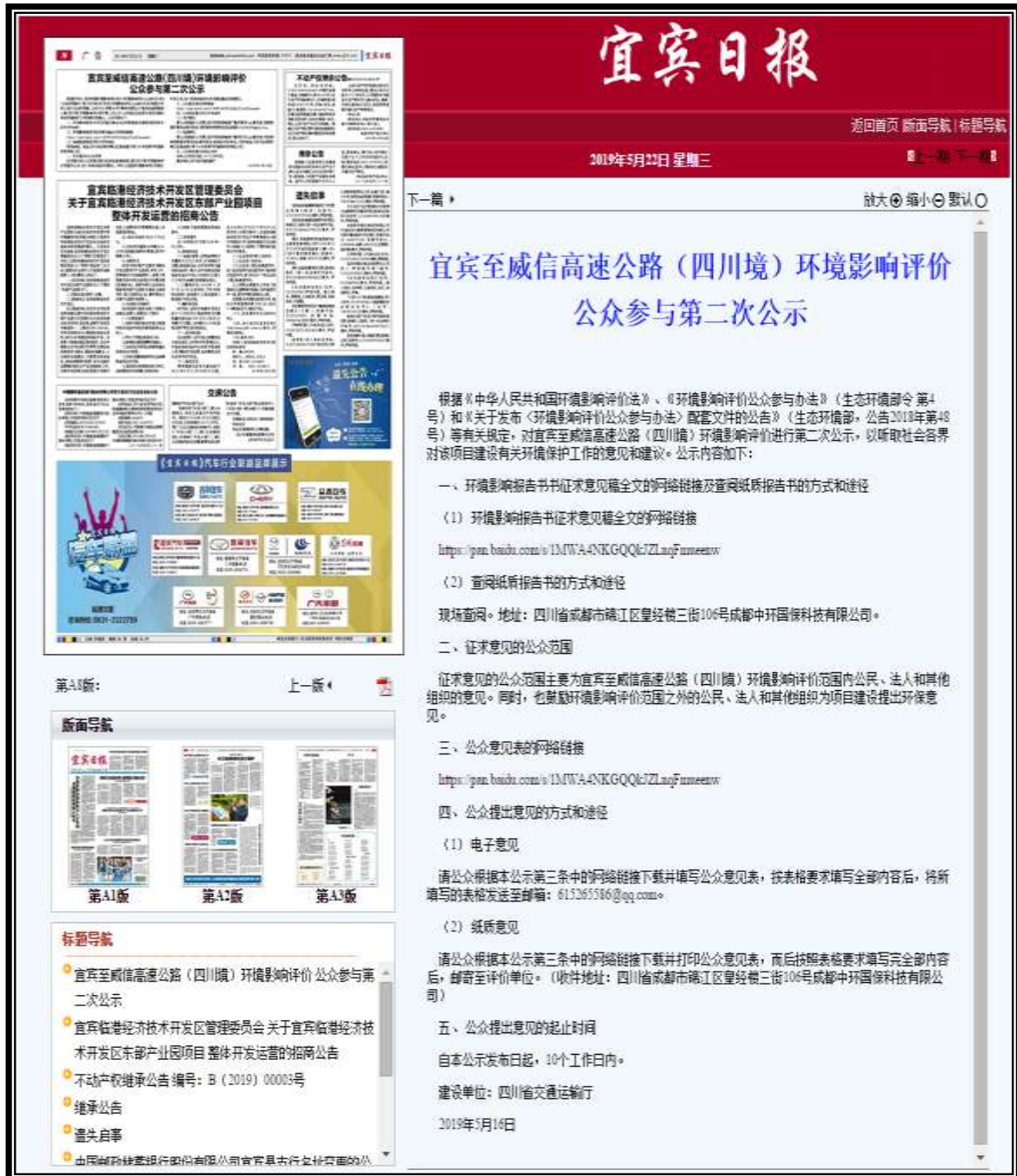
图 5 5月22日公示报纸公示（第二期）