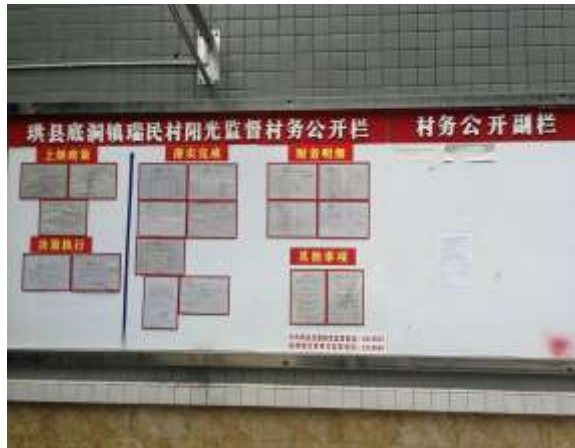
珙县底洞镇瑞民村阳光监督村务公开栏 村务公开副栏