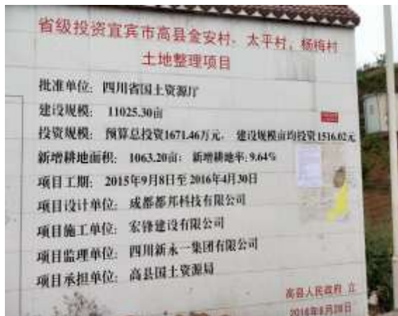
起点位置张贴公告