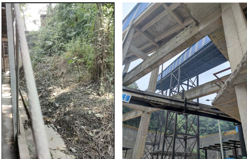
图8-1 项目周围环境现状

本项目位于四川省乐山市峨眉山市九里镇四川峨胜水泥集团股份有限公司自有的石灰石矿山上（项目地理位置见附图1），根据现场踏勘，项目拟建地现为矿石输送带廊道，周围主要为山体和树林以及电气室，值班室等，本项目评价范围内没有居民敏感点。本项目拟建地现场周围环境情况见图8-1。