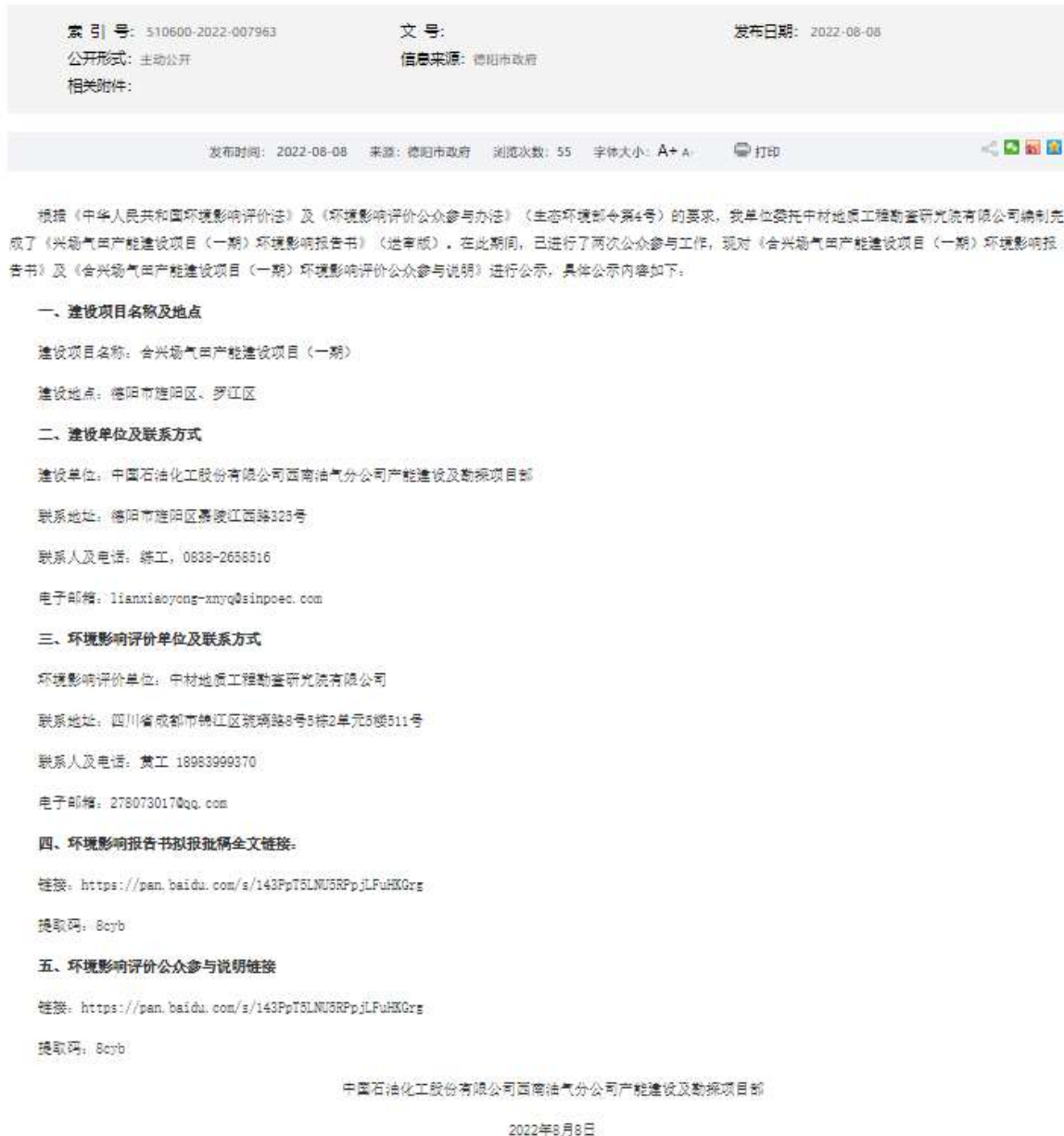
图 5.2-1 报批前网络公示截图