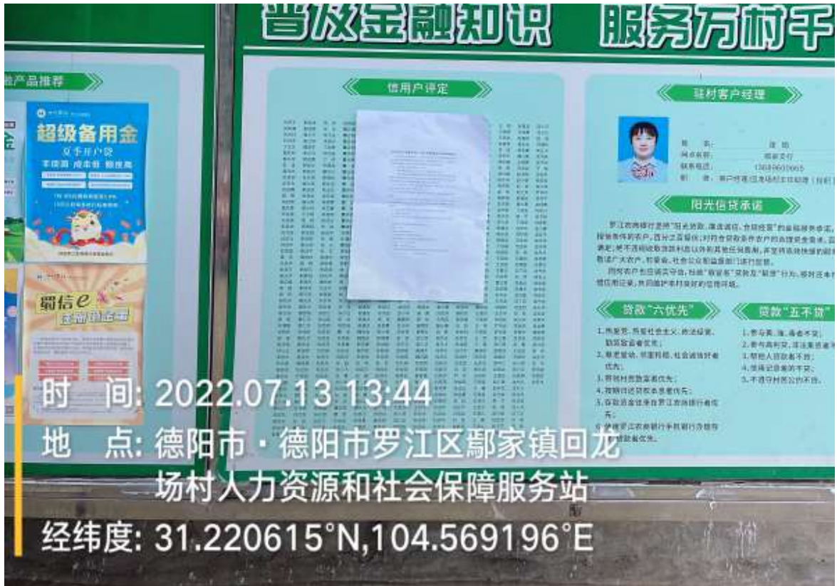
罗江区鄯家镇回龙场村村委会张贴公告照片