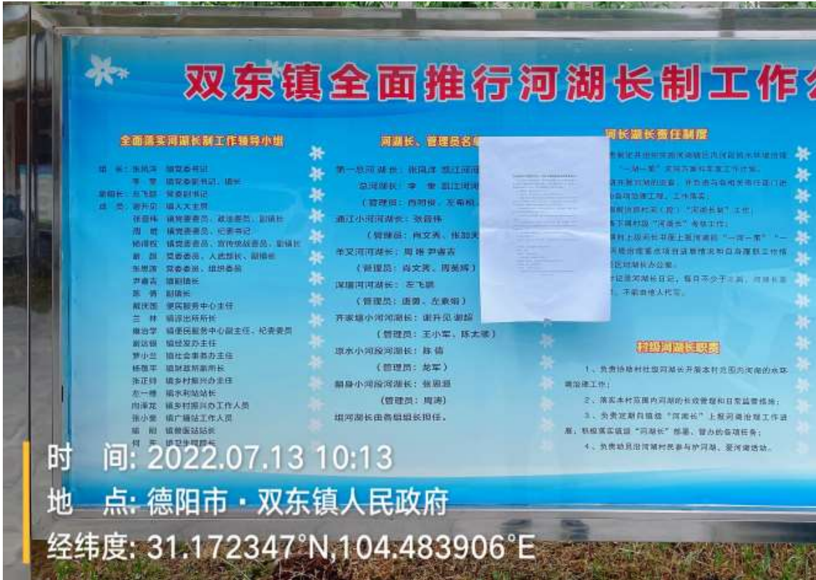
旌阳区双东镇人民政府张贴公告照片