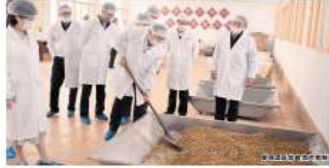
体验中药制作全过程