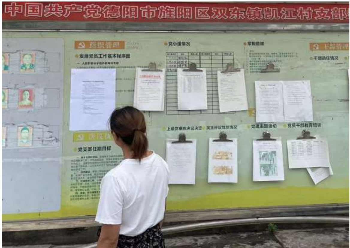
旌阳区双东镇凯江村村委会张贴公告照片