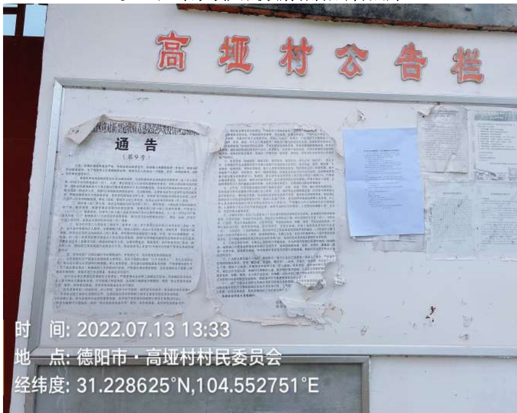
罗江区鄢家镇高埡村村委会张贴公告照片