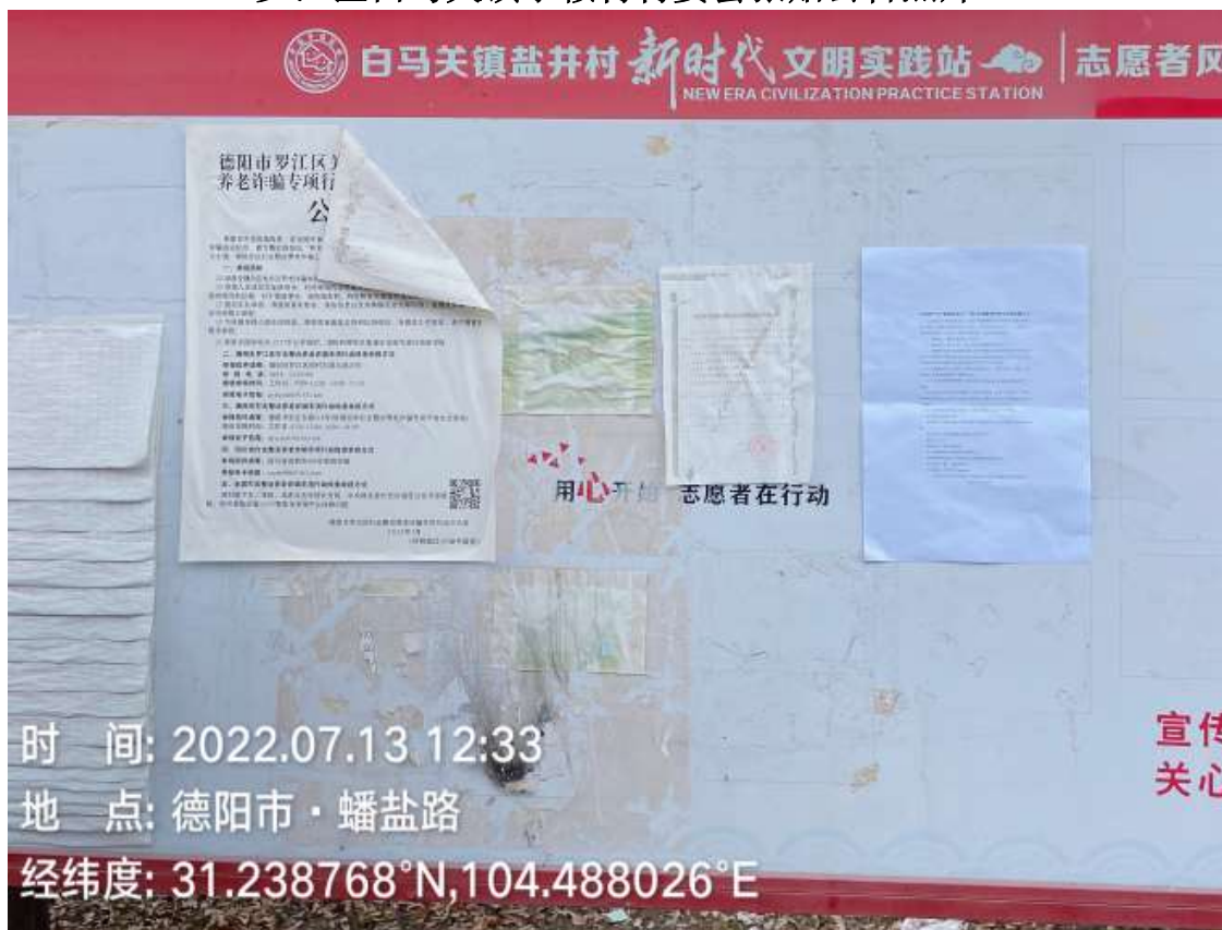
罗江区白马关镇小鞍村村委会张贴公告照片

时间: 2022.07.13 12:33 地点: 德阳市·蟠盐路 经纬度: 31.238768°N,104.488026°E