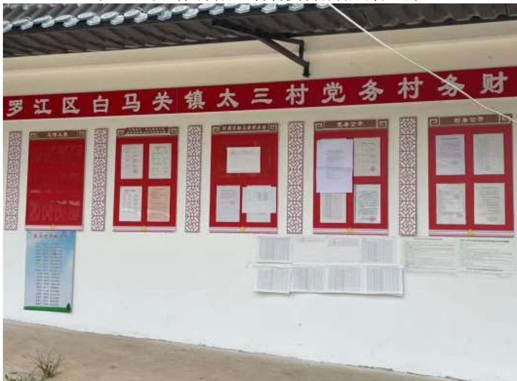
罗江区白马关镇太三村村委会张贴公告照片