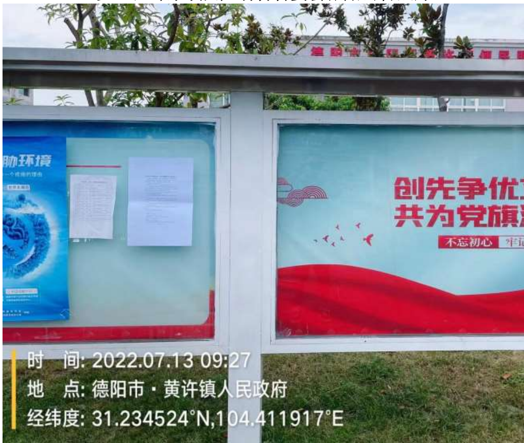
旌阳区黄许镇人民政府张贴公告照片