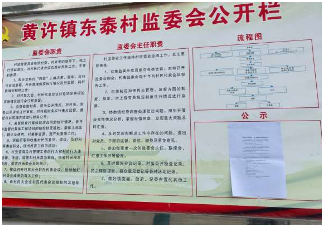
旌阳区黄许镇东泰村村委会张贴公告照片