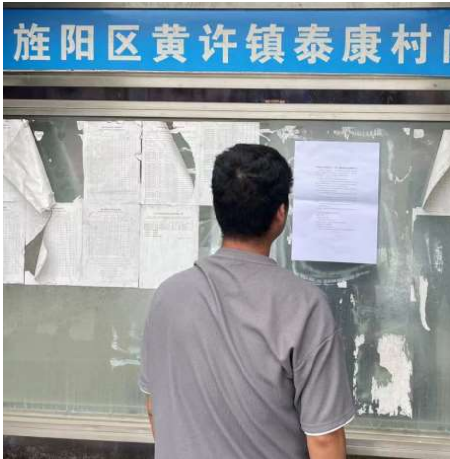
旌阳区黄许镇泰康村村委会张贴公告照片