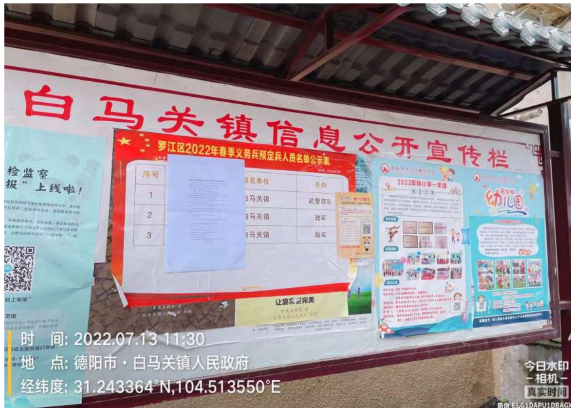
罗江区白马关镇人民政府张贴公告照片

我单位分别在项目所在地罗江区白马关镇、旌阳区黄许镇、双东镇、鄢家镇人民政府公示栏进行了公示张贴，同时在白马关镇合圣村、太三村、小鞍村、盐井村、黄许镇东泰村、泰康村、双东镇八佛村、凯江村、钻石村、鄢家镇高垭村、回龙场村的村委会公示栏进行了公示张贴，公示时间为2022年7月13日起10个工作日，公示张贴的照片详见图3.2-3。采用在项目所在地政府公告栏进行张贴公示有利于项目区公众了解获取本项目的环境影响情况，张贴公告的区域均为建设项目所在地公众已于知悉的场所，项目现场张贴公示区域选取符合《办法》中的要求。