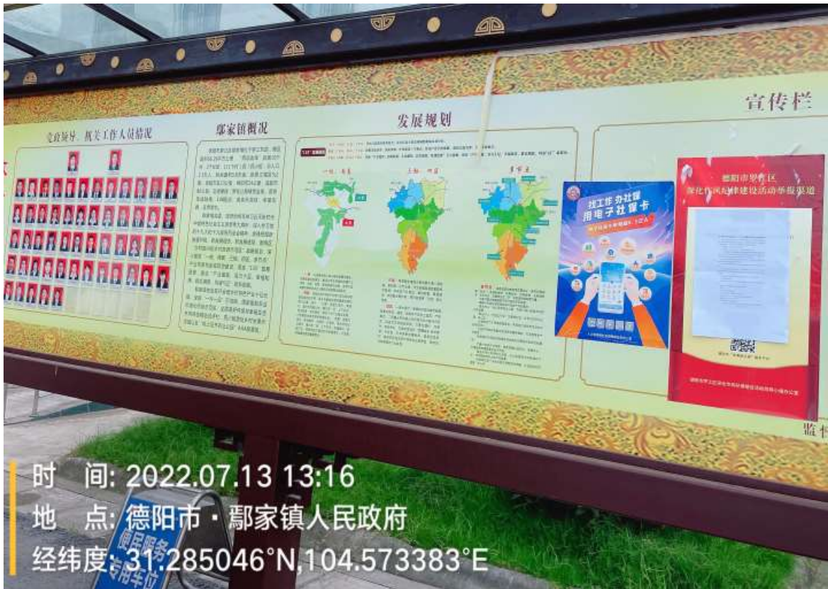
罗江区鄢家镇人民政府张贴公告照片