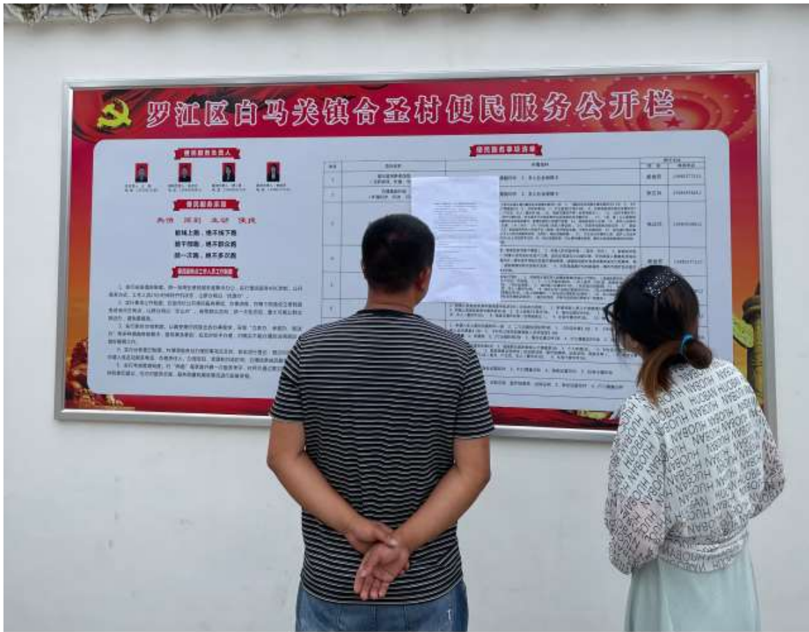
罗江区白马关镇合圣村村委会张贴公告照片