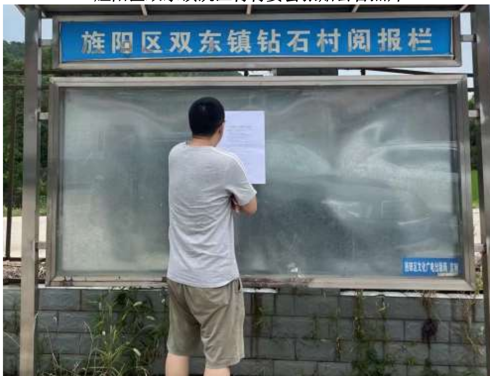
旌阳区双东镇钻石村村委会张贴公告照片