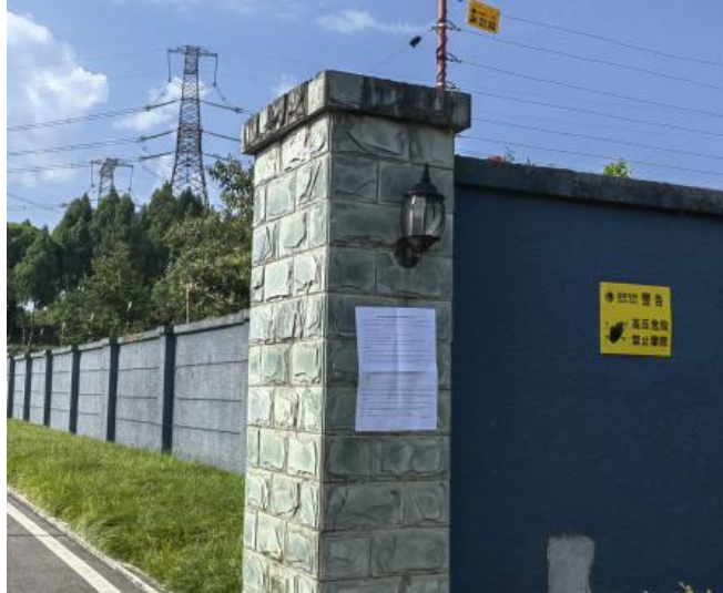
图 3-4 现场公示照片

我单位于 2023 年 12 月 18 日在南充 500kV 变电站站址处张贴了《南充 500 千伏主变扩建工程项目环境影响评价公示》，现场张贴照片如下：