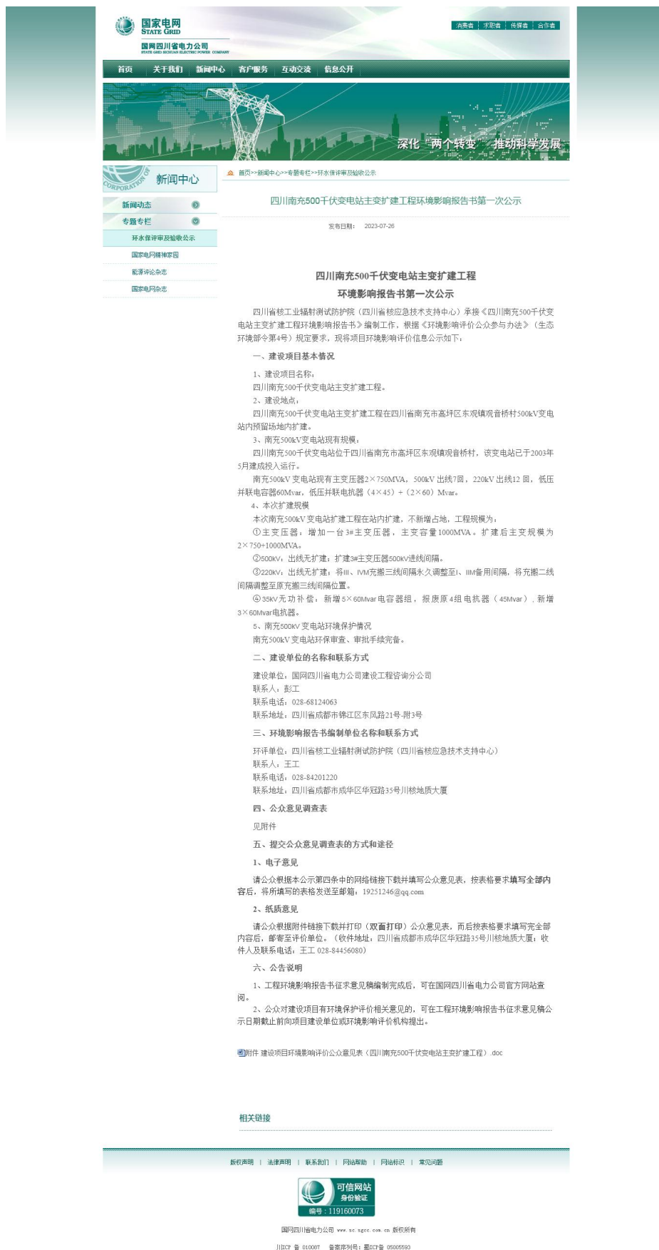
图 2-1 第一次公示截图