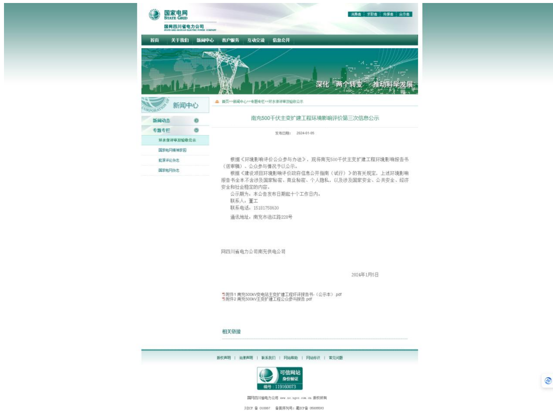
图 6-1 报批前公示截图

公开网址如下 http://www.sc.sgcc.com.cn ，公示截图见图 6-1。