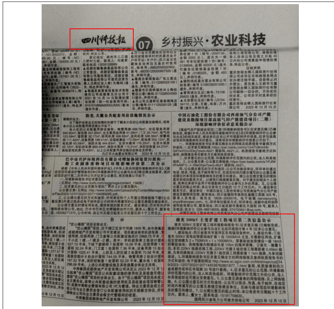
图 3-3 报纸第二次公示