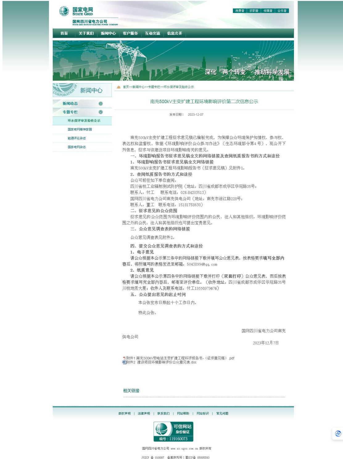
图 3-1 征求意见稿公示截图