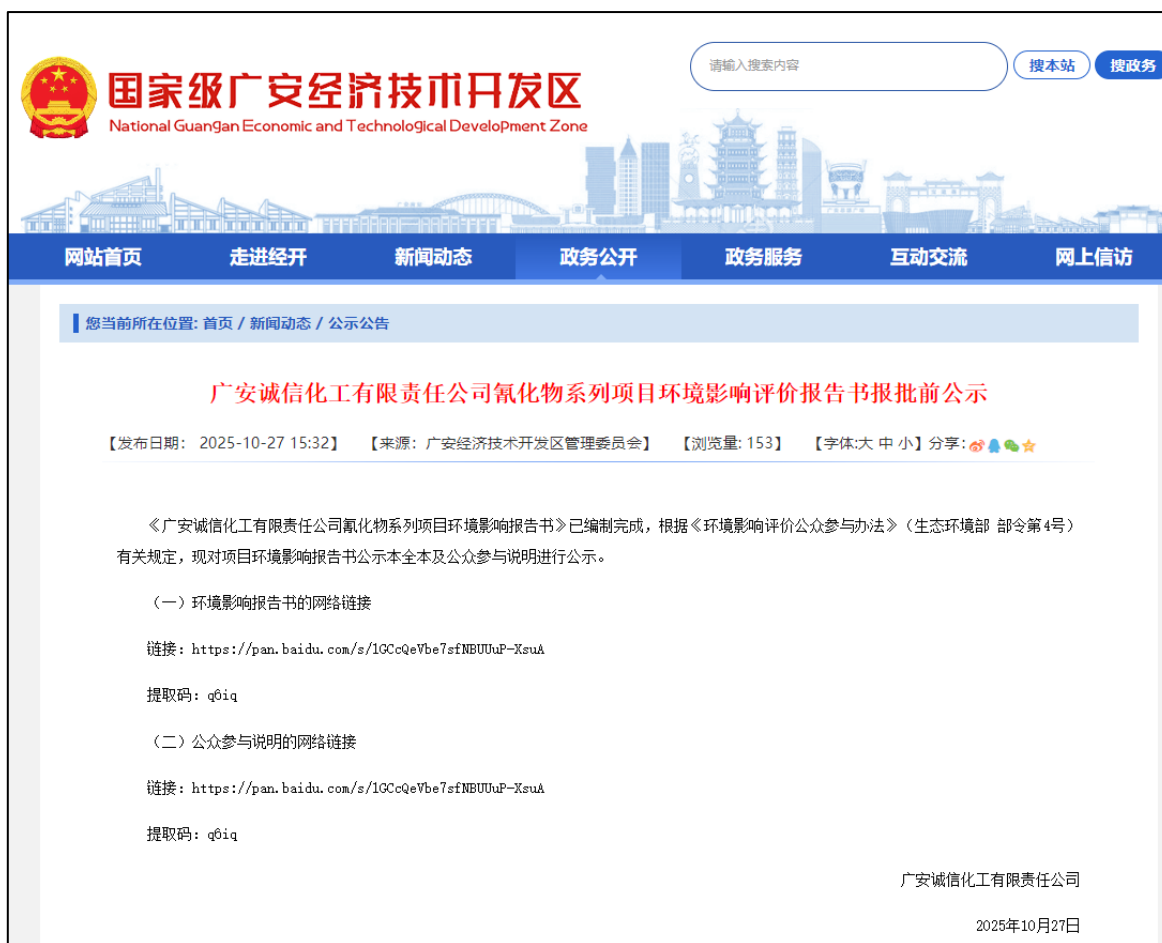
图 6-1 报批前公开网络公示截图