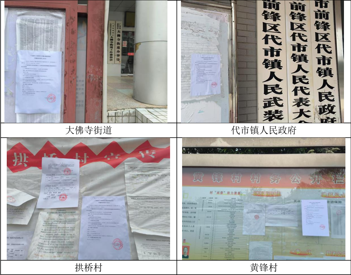
图 3-4 张贴公示

企业于 2025 年 4 月 9 日~4 月 23 日（10 个工作日）对项目进行了张贴公示，公示情况如下：