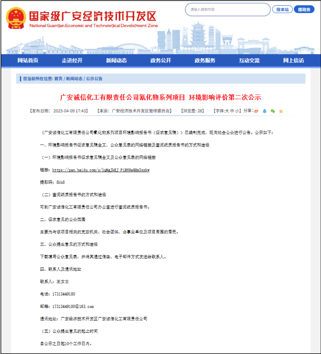
图 3-1 征求意见稿网络公示截图

项目第二次网络公开，公示时间 2025 年 4 月 9 日~4 月 23 日（10 个工作日），在国家级广安经济技术开发区网站（ https://gajkq.guang-an.gov.cn/gjjgajjjskfq/c104015/pc/content/content_1909906120840687616.html ）公示，国家级广安经济技术开发区网站为建设项目所在地的政府网站，符合国家生态环境部令（部令第 4 号）《环境影响评价公众参与办法》公示网络平台的要求。第二次网上公示截图如下：