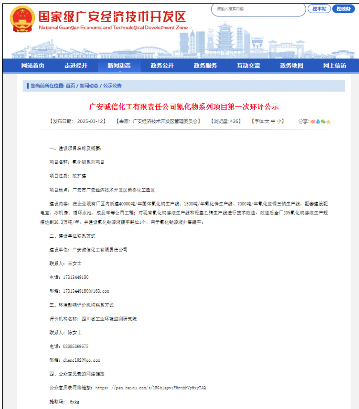
图 2-1 首次环境影响评价信息网络公示截图