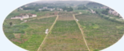
“十四五”以来，邻水县工业经济持续健康发展。

时间轴在转动，年轮在更迭。 “机器轰鸣声、车水马龙的繁忙、昼夜不息的辛勤耕耘——邻水的三产，正以蓬勃之势，在高质量发展的道路上奋力前行。这里，创新思维不断碰撞，奋进之志持续激荡，发展蓝图不断铺展。 “十四五”以来，邻水县以“工业强、农业稳、服务业活”为总抓手，坚持“三产融合”发展思路，走出了一条工业强县、农业稳县、服务业活县的发展之路，全县经济持续健康发展，民生福祉持续改善，城乡面貌焕然一新。