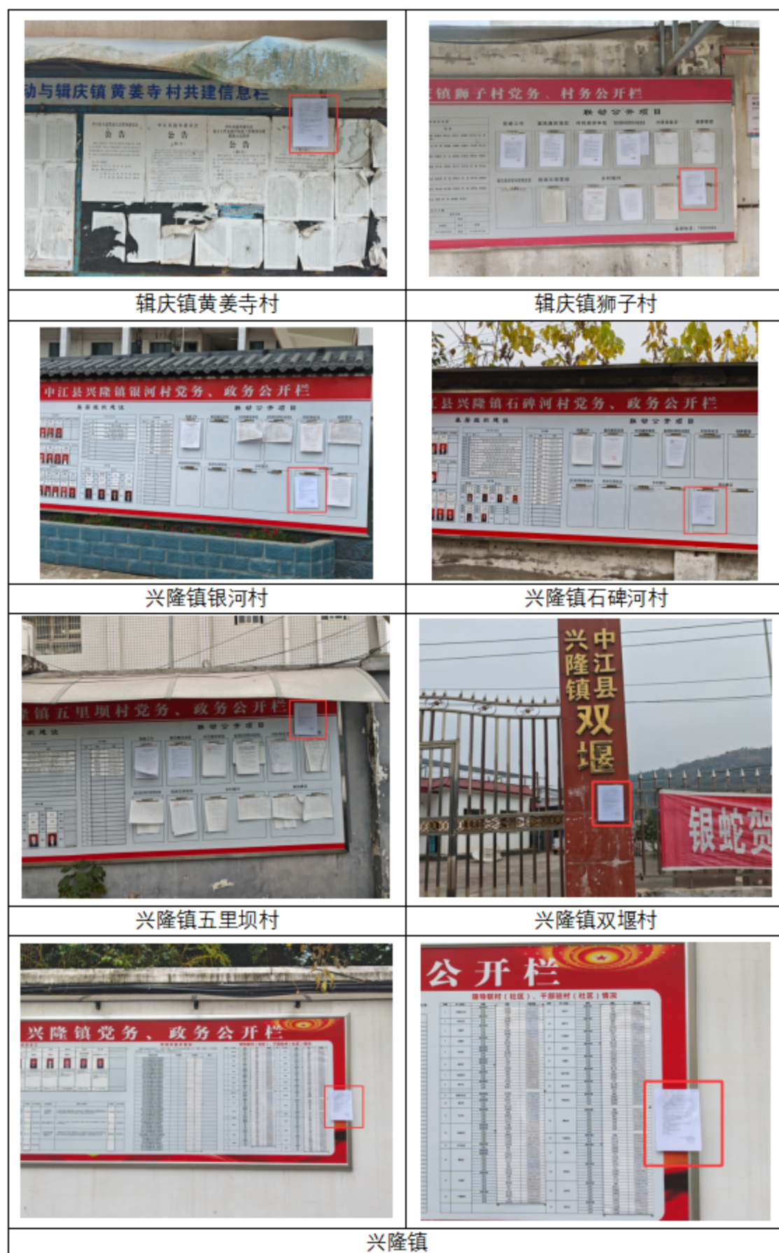
图5 现场张贴公示公告照片