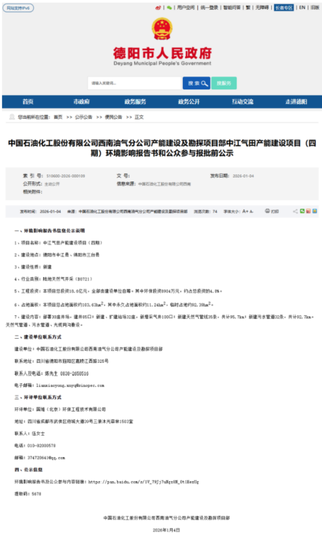
图6 报批前网络公示截图