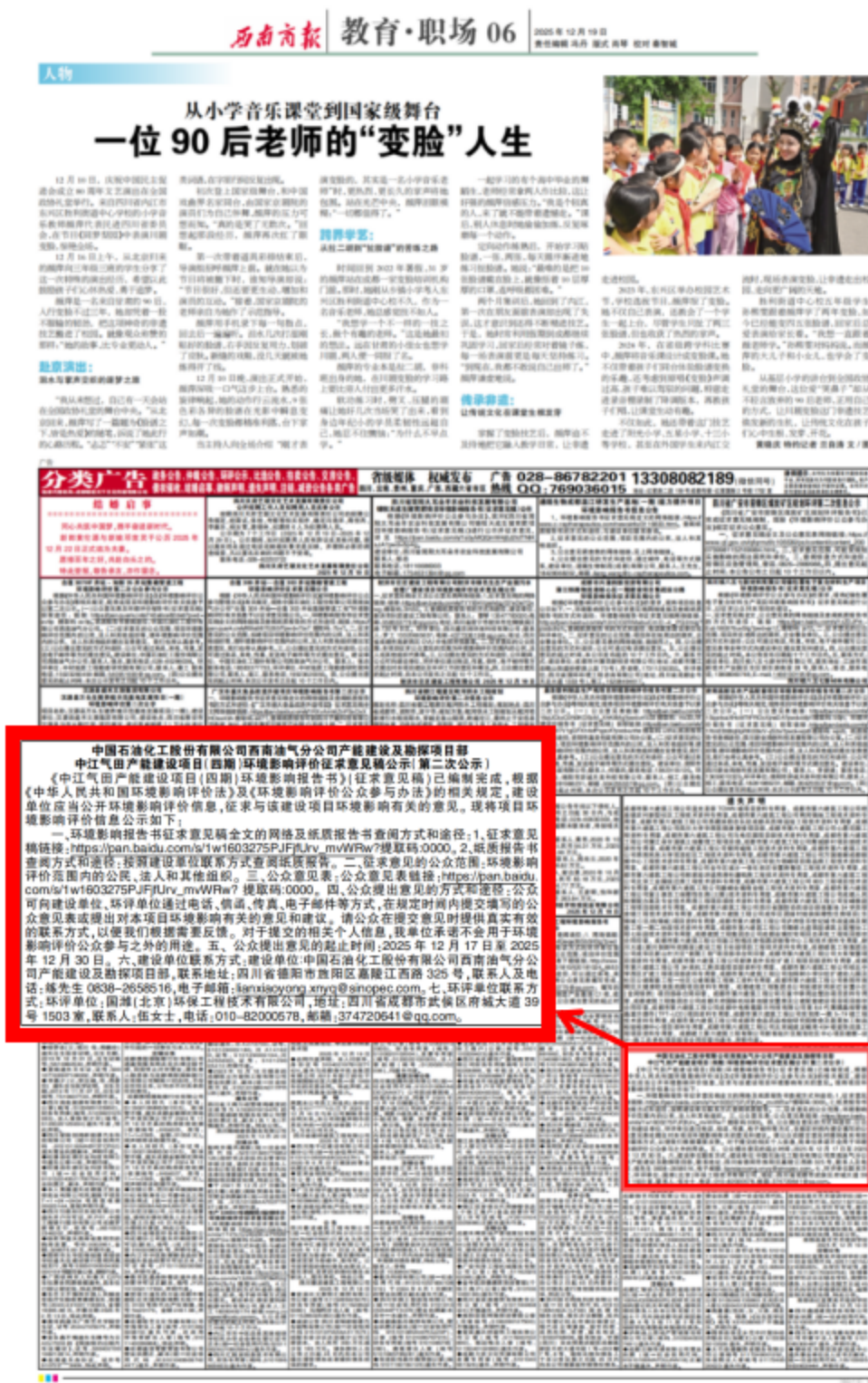
图3 2025年12月19日《西南商报》报纸公示截图

中国石油化工股份有限公司西南油气分公司产能建设及勘探项目部选择了本项目所在地较为权威且公众易于接触的《西南商报》作为报纸公开载体，于2025年12月19日和2025年12月24日在《西南商报》分别进行了报纸公示。报纸公示截图如下。