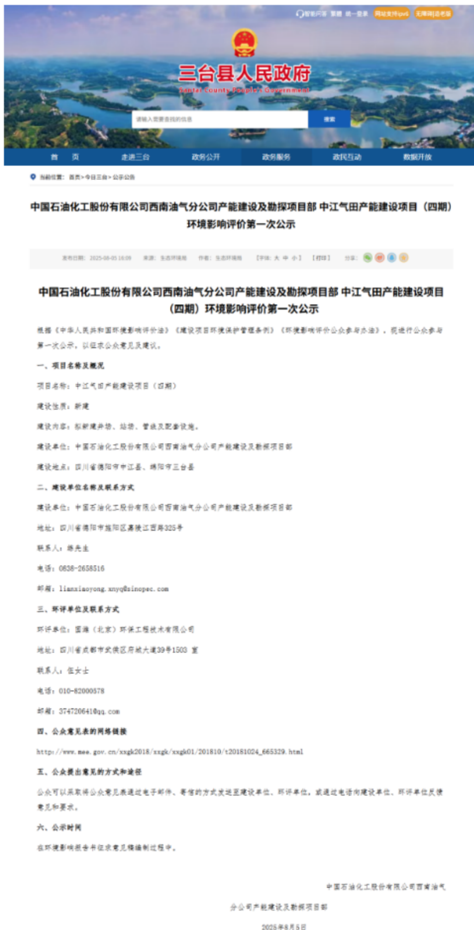
图1 第一次网络公示截图